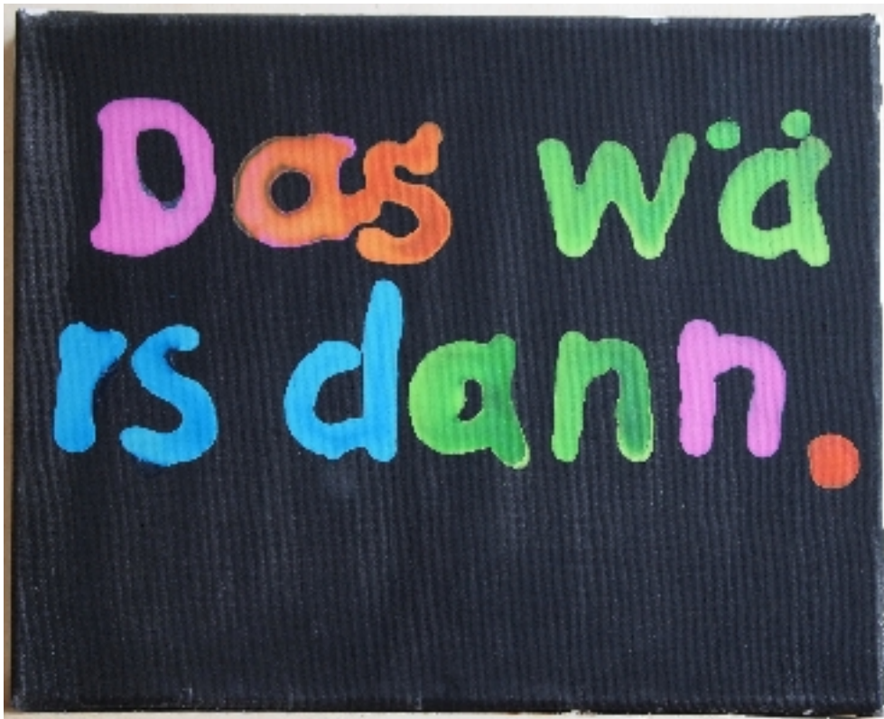
Björn Saul Das wärs dann (2011) Goache auf Leinwand Maße: 24 x 30 cm