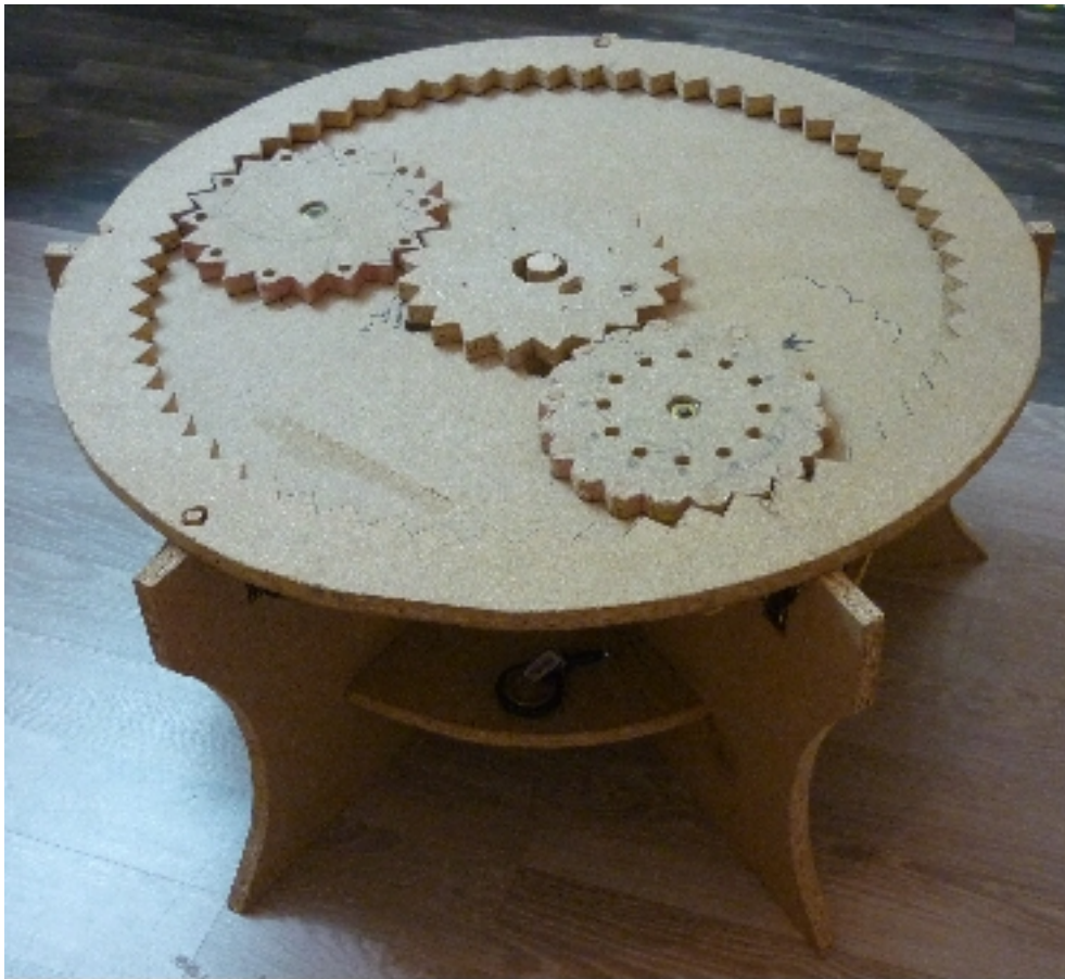
Katrin Herzner TISCH (2008) Pressspanplatte, mixed media Höhe: 37cm, Durchmesser 120cm