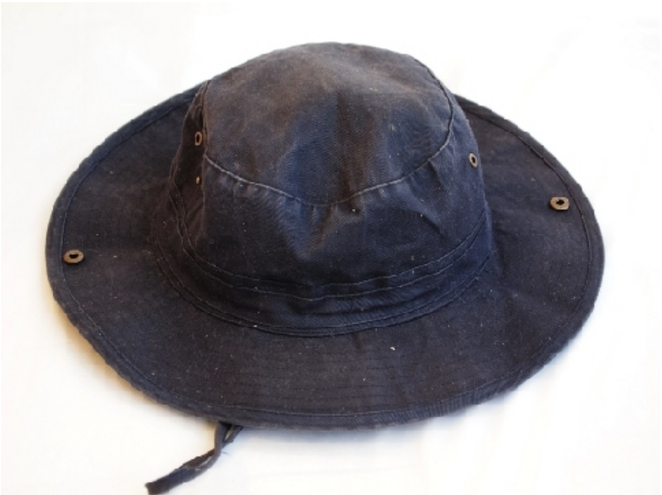
Katrin Herzner Hut (2011), Textil, mixed media, Durchm. Krempe: 31 cm, Durchm. Kopf: 18 cm, Höhe: ca. 9 cm