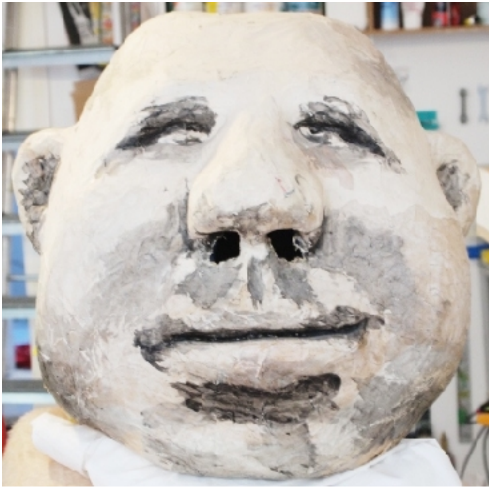
Katrin Herzner Trägheit (ca. 1997) Pappmasché und Textil, Acrylfarbe Maße: ca. 50 x 50 x 54 cm