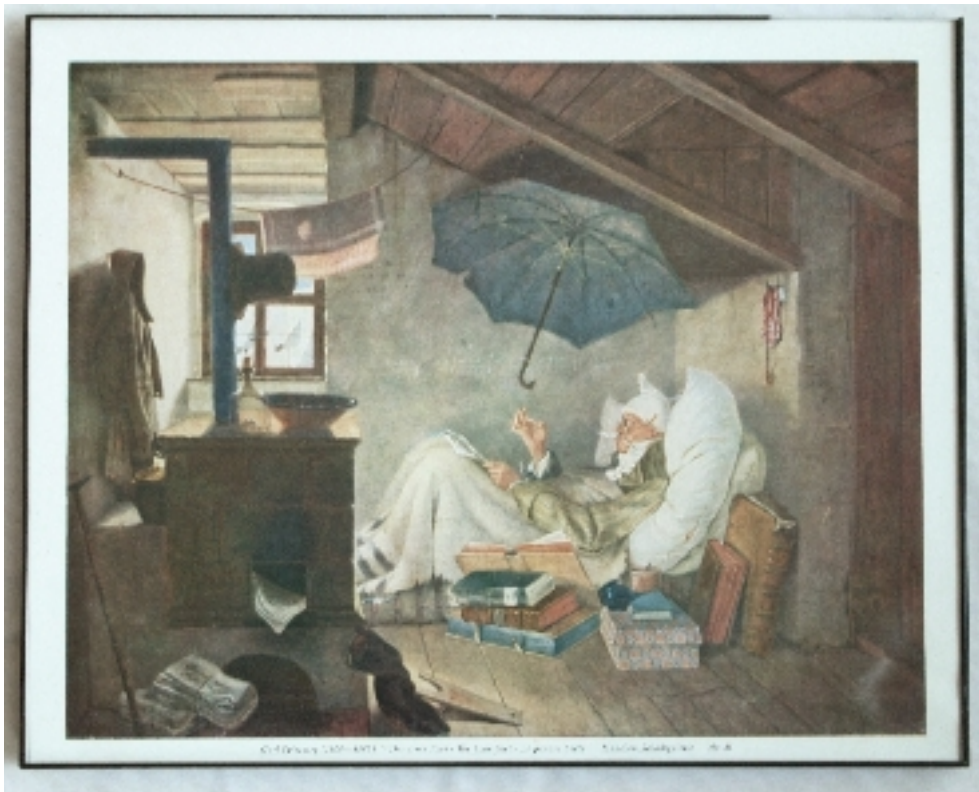
Angelika Bittner / Karls Spitzweg armer Poet (19??/18??) Kalenderblatt gerahmt Maße: 24,5 x 30 cm, Rahmen beschädigt