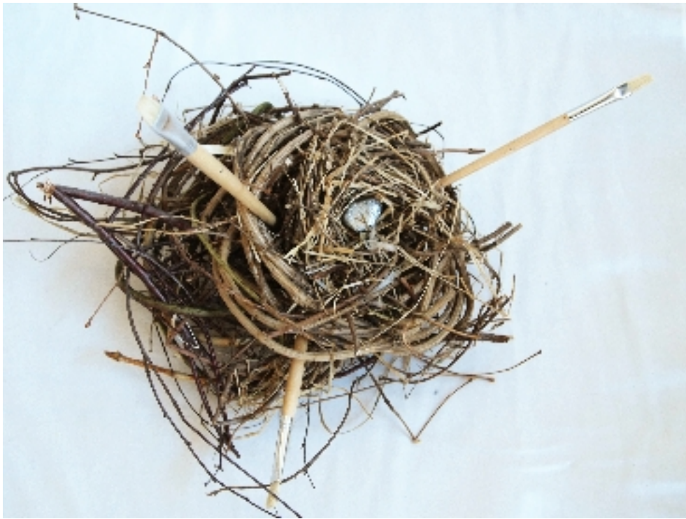
Jonas Lemm unbekannt (2010) Naturmaterialien und Pinsel, Stein, Silberlack Maße: ca. 35 x 25 x 35 cm