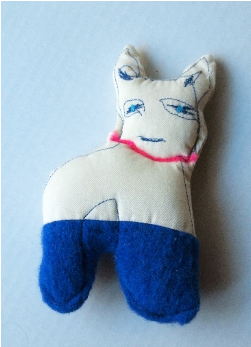
Franziska Degendorfer unbekannt (ca. 2008) Stoff, mixed Media Maße: 15 x 10 x 4 cm