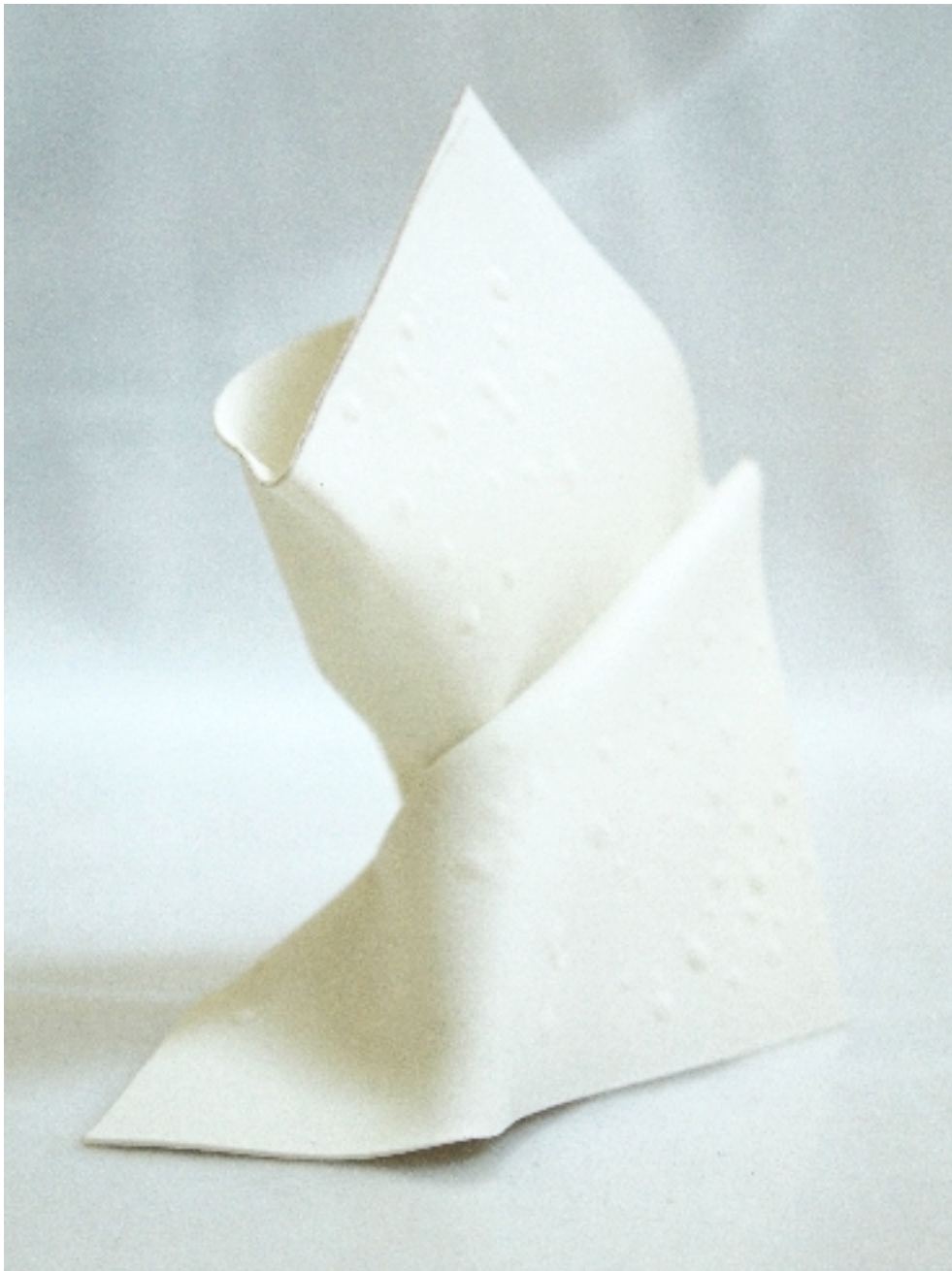
Manon Bellet Objekt aus Keramik (?) (2011) Keramik (?) Maße: ca. 13x12x7cm