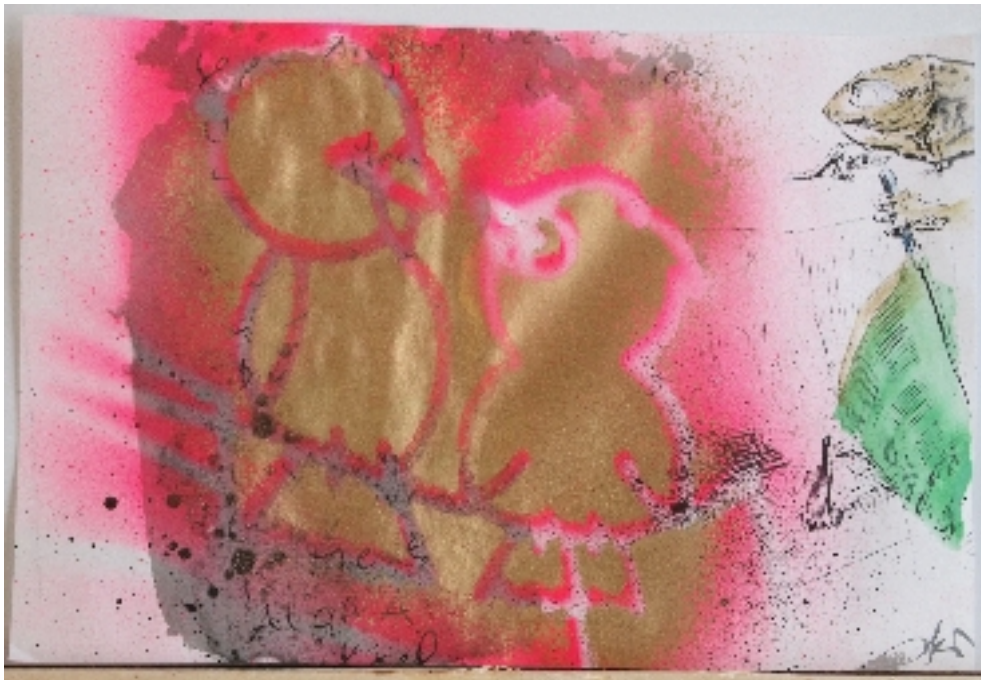
Axel Heil aus der Reihe: LOST IDEA AREA - Fluid Editions (2010) Material: Lack gold/neonpink und mixed media auf Papier Maße: 14 x 21 m umseitig signiert mit Widmung